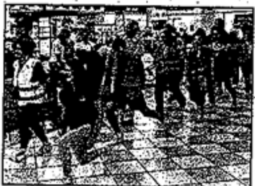
Passerella alla Fattoria